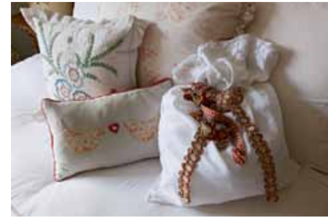
Taies d'oreiller anciennes agrémentées de fines garnitures de passementerie de la collection de Deborah.