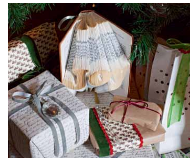
Parmi les jolis emballages, un livre très décoratif traité par la technique de l'origami.