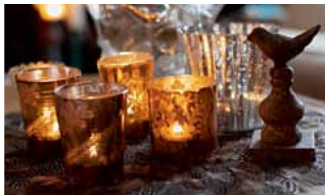
Touche de féerie avec la lumière diffusée par un regroupement de photophores en verre décoré.