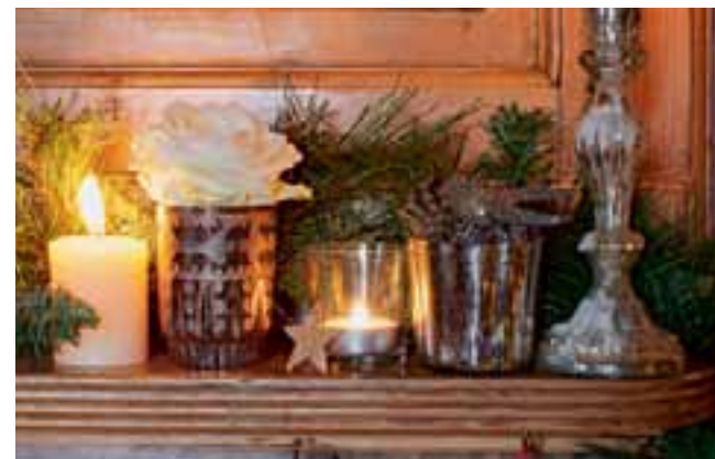
La cheminée du salon se pare de guirlandes festives et scintille sous la flamme des photophores. Étoile en bois et pommes de pin apportent la note rustique.

TEXTE ET STYLISME : ALI HEATH