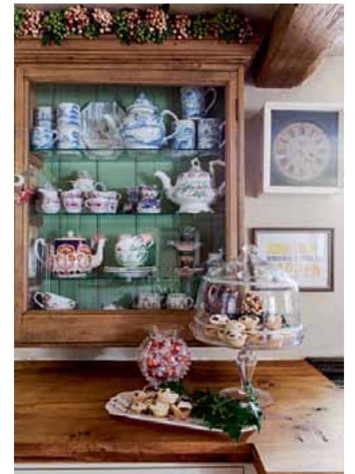
L'intérieur d'une vieille armoire en bois a été peint d'une belle teinte vert pomme pour accueillir les collections de porcelaine de Deborah.