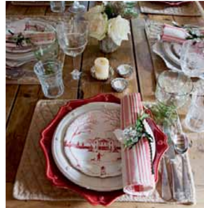
Sur la table de fête, la belle vaisselle, collection Winter Frolic, inspirée du style Delft, et les couverts Villandry, le tout de la marque Juliska.