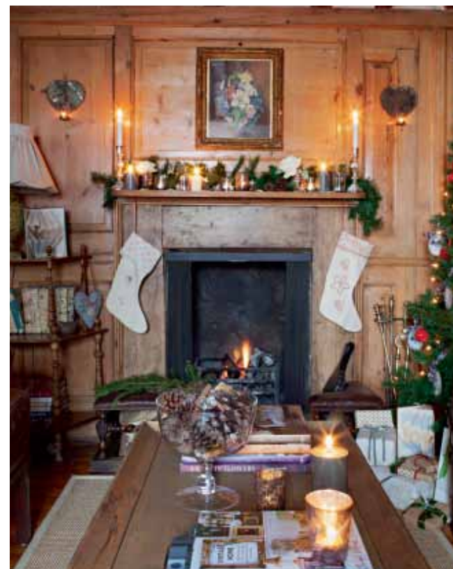
Douce ambiance de magie dans le salon. Les murs lambrissés contribuent à l'atmosphère chaleureuse de la pièce éclairée en toute intimité par la flamme des bougies.