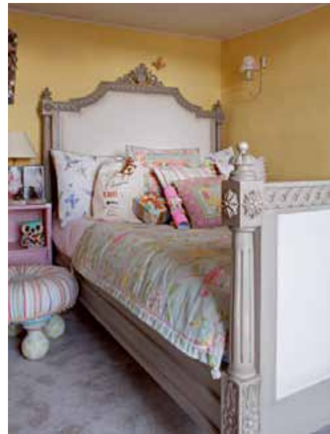
La chambre d'Emily, la fille de Deborah, marie les teintes douces et les textiles colorés pour un univers tout en sérénité.