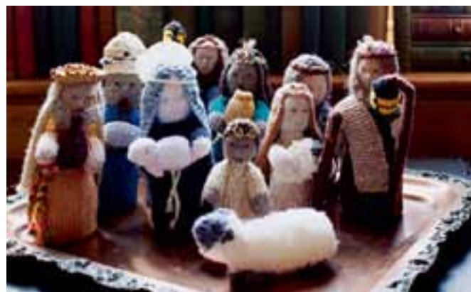
Pour une mise en scène très originale, des santons réalisés au tricot.