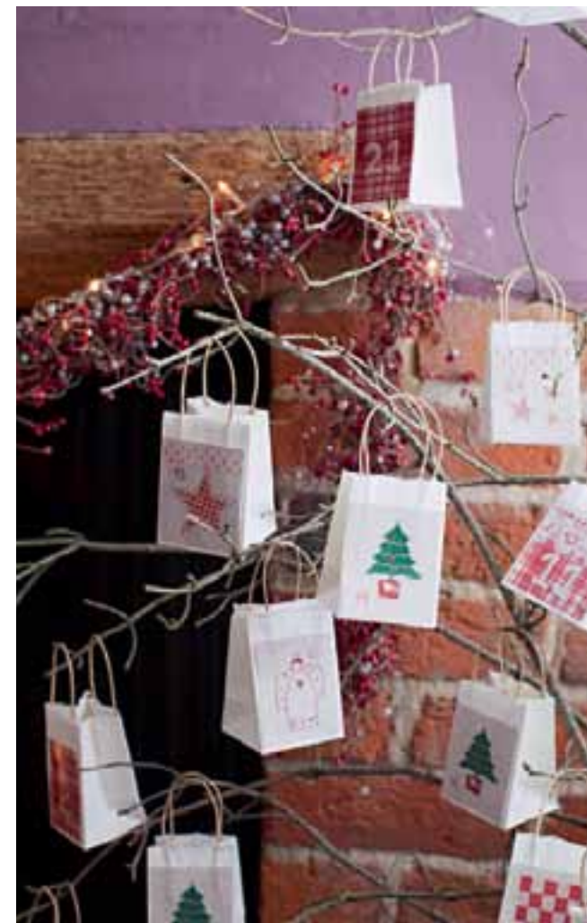
Dans un coin du salon, un bouquet de branchages se pare, en guise de boules, de petits paquets cadeaux décorés aux couleurs traditionnelles de Noël.