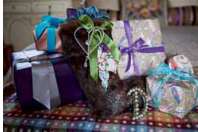
Deborah apporte un soin tout particulier à l'emballage des cadeaux, richement orné de satin, de perles et de jolis papiers.